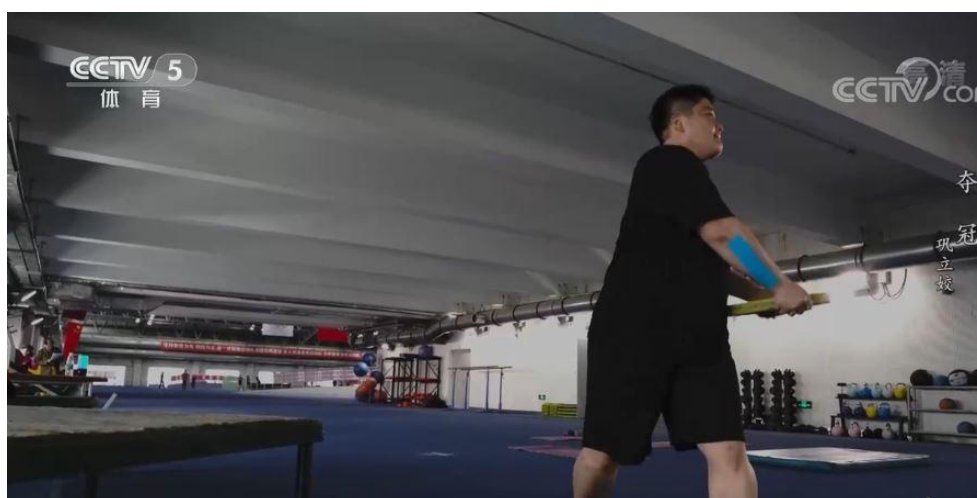
二十多年艰苦训练，梦想与热爱支撑着她走到了今天