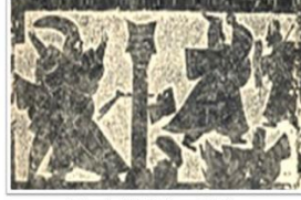
《山海经》中荆轲刺秦王所献之地图