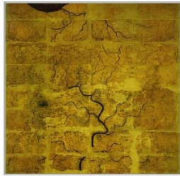
汉长沙国 深平防区 古军事地形图

汉朝(西汉)的古地图是中国最早的古地图，1973年12月发现于湖南省长沙马王堆3号西汉墓，是中国现存时代最早的地图之一。